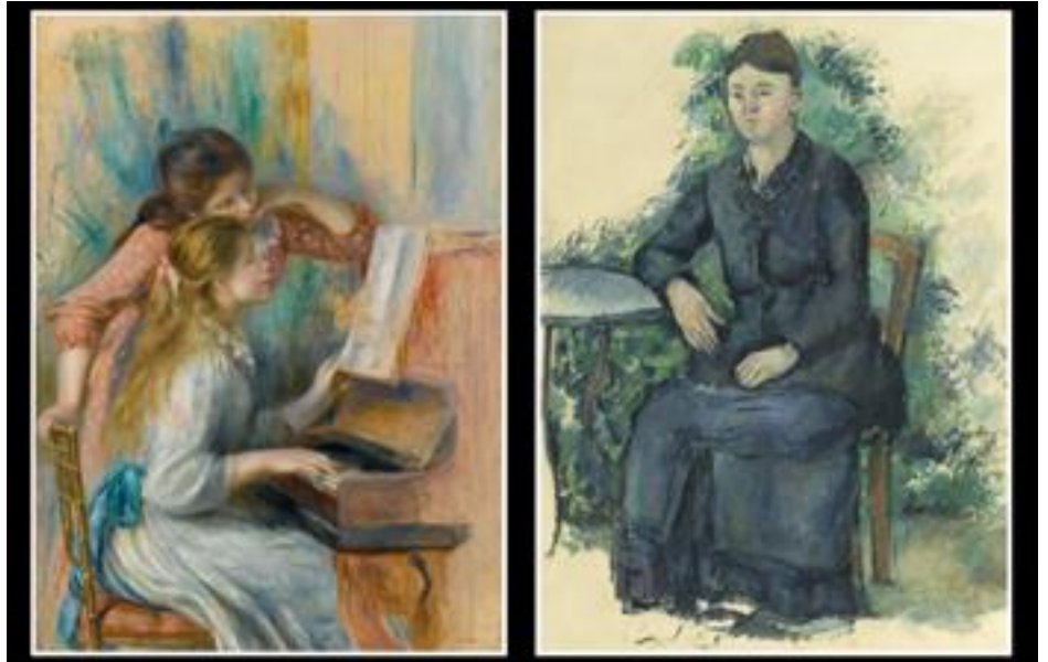
Pierre-Auguste Renoir (1841-1919) et Paul Cézanne (1839-1906) : trajectoires de deux grands maîtres de la peinture

Cézanne, Renoir , les voilà réunis pour faire vivre les cimaises de la Fondation avec des œuvres qui se comparent, se confrontent, s'émancipent et deviennent enfin tutélaires des futures avant-gardes du XXe siècle. Tel se révèle le défi que les musées de l'Orangerie et d'Orsay à Paris démontrent cet été avec quelque 60 tableaux.